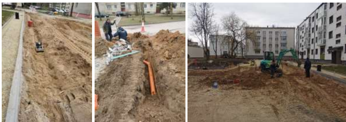
Lietaus nuotekų tinklų remontas V. Kudirkos g., Naujoji Akmenė