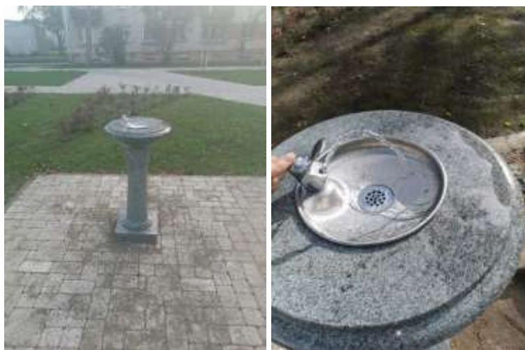
Geriamojo vandens stotelė Lazdynų Pelėdos g., Naujoji Akmenė