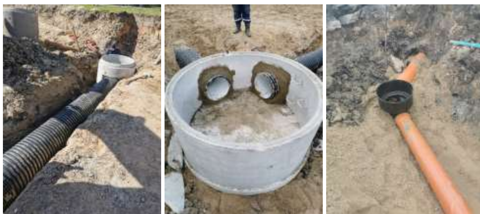
Lietaus nuotekų tinklų remontas Respublikos g., Naujoji Akmenė